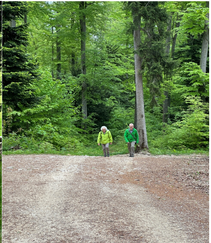
Nach dem Mittagessen laufen wir nochmals hinauf...