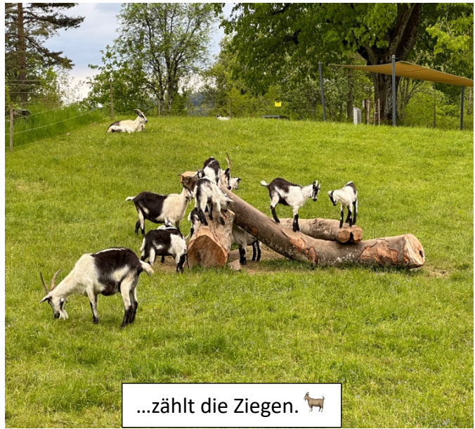
...zählt die Ziegen. 🐐