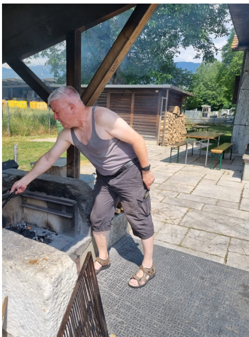
Grillieren auf offenem Feuer