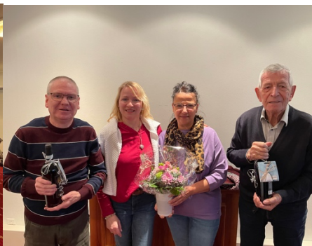
Dankesgeschenk und Ehrungen