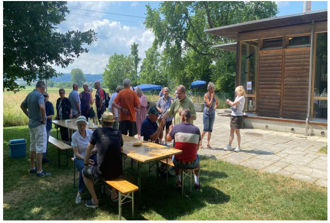
Begrüßung und Apéro 🍷🍷