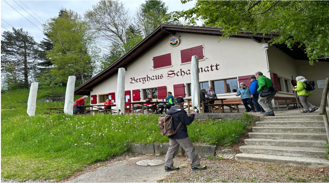
... in Richtung Schafmatt.