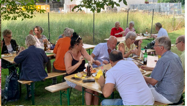
Feines Essen und Trinken