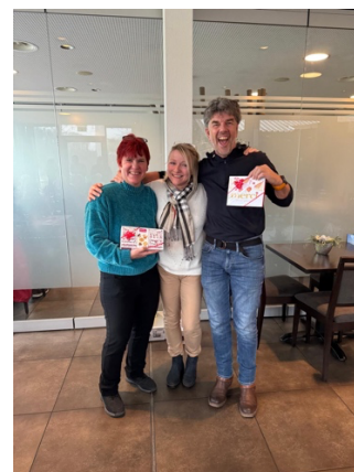
Danke für's Chauffieren!