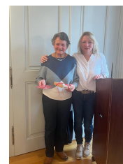
55 Jahre im Verein