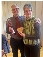
Danke für die Zeit für Flaschenarbeit